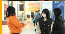
駅頭は大勢の市民の方のお話がかがえる 貴重な機会です。