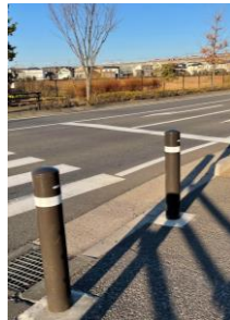
(赤などの現職でない) 景観配慮された安全ポール