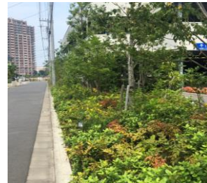
グリーンチェーンを推進してきた流山市。みどりが映える景観に調整する必要があります。