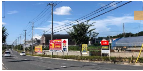
自己主張の強い広告物が乱立