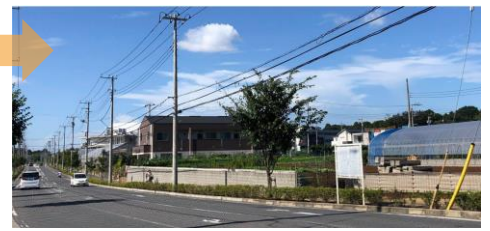
自然の「みどり」が映える「まちなみ」