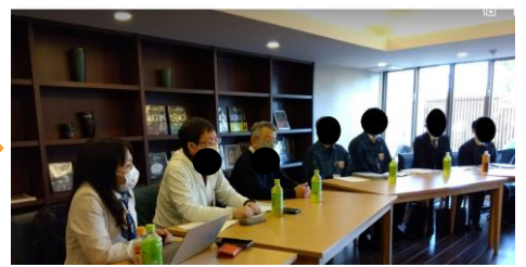
問題解決に向けて、住民、行政、民間、議員で共に様々な知恵だしを行う勉強会を開催(約2年間)。住民の方々の冷静でしっかりとした会議運営に感謝申し上げます。