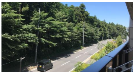
いきなり森の前に電柱が。。何とかしたいと相談が