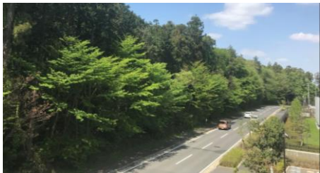
もともとは電柱がない、美しい市野谷の森の景観

令和3年8月 森の景観を気に入って住宅を購入したのに電柱が・・・という相談が入り、勉強会が立ち上がりました。