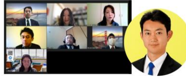
児童虐待・不登校支援調査チームと熊谷知事オンラインミーティング

急増している児童虐待件数の数字です。県の管轄である児童相談所との連携が必要なことから、千葉県知事と市町村議員のネットワーク「幹を強くする千の葉の会」を通じて調査を行い、 人員体制の強化を訴え、+4人増を実現 。また県施設である児童相談所と基礎自治体における連携強化に向けて情報交換を行い、 県職員と基礎自治体職員との人員交流を提案、実現しました 。